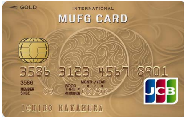
「MUFGカード ゴールド JCB」