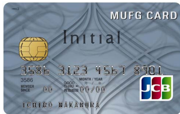
「イニシャルカード JCB」