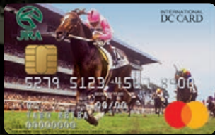
トウカイテイオー