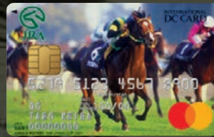
ジャングルポケット