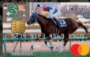
ダイワスカーレット

Mastercard®のほかにVisaもございます。 新カードのブランドは、現在お持ちのカードと同じブランドを発行いたします。