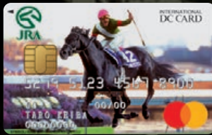
シンボリクリスエス