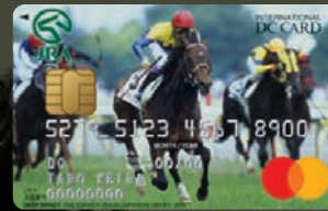
ディープインパクト