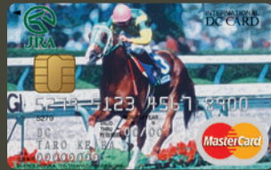
サイレンススズカ —宝塚記念 1998—