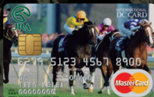
ウオッカ —天皇賞・秋 2008—