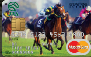
ジャングルポケット —ジャパンカップ 2001—