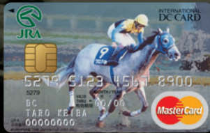
クロフネ —ジャパンカップダート 2001—