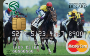
ディープインパクト —日本ダービー 2005—