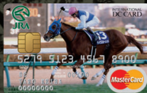
ダイワスカーレット —有馬記念 2008—

Mastercard®のほかにVisaもございます。 新カードのブランドは、現在お持ちのカードと同じブランドを発行いたします。