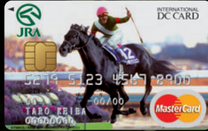
シンボリクリスエス —有馬記念 2003—