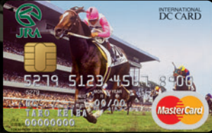
トウカイテイオー —日本ダービー 1991—