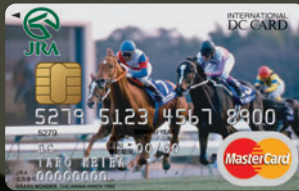
グラスワンダー —有馬記念 1999—